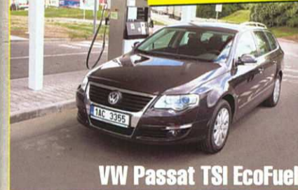
VW Passat TSI EcoFuel