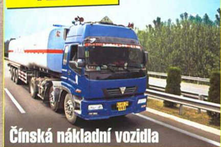
Čínská nákladní vozidla