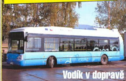
Vodík v dopravě