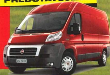
Fiat Ducato Natural Power